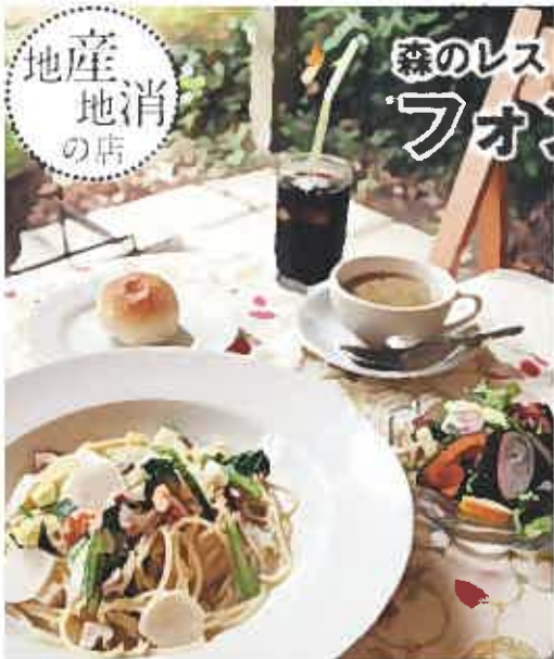
パスタランチ メインの「エミレ、あじり野菜のオイルソースパスタ」に自家製手ごねパン、スープ、サラダ、ドリンクが付いて1000円